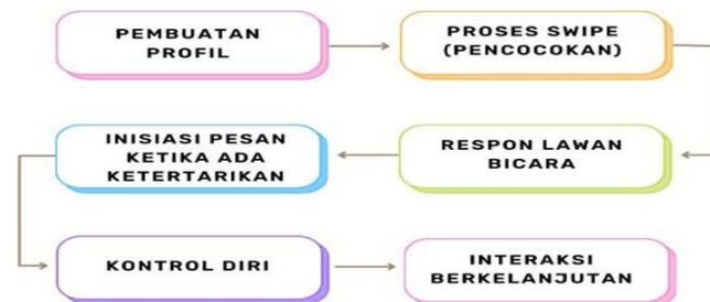
Gambar 3. Diagram pola komunikasi di aplikasi bumble

bumble tidak lagi dipandang semata sebagai platform pencarian pasangan, tetapi juga sebagai ruang yang rawan terhadap tindakan tidak etis. Dampak ini pada akhirnya menurunkan kepercayaan pengguna, membuat sebagian dari mereka merasa tidak aman atau enggan melanjutkan penggunaan aplikasi. Selain itu, perilaku menyimpang ini berkontribusi pada penurunan citra merek Berdasarkan hasil penelitian mengenai pola komunikasi dalam interaksi daring di aplikasi Bumble, dapat disimpulkan bahwa dalam komunikasi yang terjadi dipengaruhi oleh beberapa dinamika utama. Pola komunikasi terbentuk melalui inisiatif pesan, gaya percakapan, serta strategi membangun kepercayaan yang digunakan oleh pengguna setiap tahap interaksi.