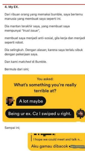
Gambar 2. Screenshoot bukti percakapan di aplikasi bumble

Selanjutnya, terdapat pola komunikasi pada pengguna perempuan yang bersifat dramatis atau manipulatif secara emosional. Hal ini terlihat dari pesan lanjutan yang menunjukkan ekspresi sedih, dengan tujuan mendorong lawan bicara untuk merespons atau berempati. Pola ini mengindikasikan adanya upaya menarik perhatian melalui emosi negatif. Terdapat juga pola komunikasi intens dan berisiko konflik emosional, beberapa narasi, terutama pada cerita "My Ex", menunjukkan bahwa interaksi di Bumble dapat berkembang menjadi hubungan yang intens namun berakhir dengan konflik emosional, seperti kecemburuan berlebihan, perselingkuhan, atau tindakan manipulatif lainnya. Komunikasi awalnya positif, tetapi bertransformasi menjadi pola yang tidak sehat dan memengaruhi kondisi psikologis pengguna.